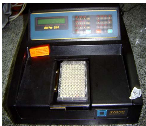
شکل ۱- دستگاه خواننده الیزا و میکروپلیت در آن جهت