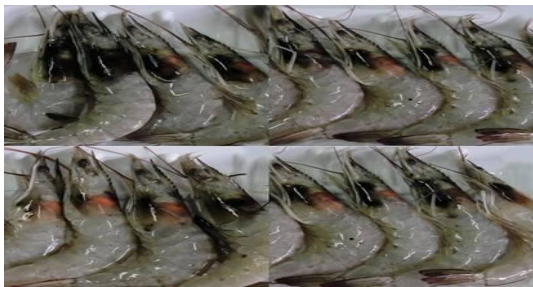
شکل شماره ۱ - لکه سیاه روی میگوی شاهد

تجزیه و تحلیل اطلاعات خام بدست آمده از آزمایشات میکروبی، شیمیایی و حسی در میگوی آزمایشی و شاهد بوسیله نرم افزار آماری SPSS و تست آنالیز واریانس دو طرفه در سطح معنی دار (۵٪) طی مدت زمان نگهداری در سردخانه انجام گرفت و تغییرات نتایج نمونه‌های آزمایشی و شاهد طی زمان مورد بررسی قرار گرفت. برای بررسی تفاوت و مقایسه بین نمونه‌های آزمایشی و شاهد از آنالیز T test استفاده شد.