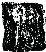
شکل ۲- یک نمونه تصویر دوتایی از یک نمونه گوشت سرخ شده

برای آنالیزهای بعد برخالی در فرک لک با استفاده از روش شمارش جعبه، باید یک الگو ۸ استخراج شده و به یک تصویر دوتایی (سیاه و سفید) تبدیل گردد. دلیل آن این است که فرک لک تنها قادر است پیکسل های سیاه در یک پس زمینه سفید و یا پیکسل های سفید در یک پس زمینه سیاه را تشخیص دهد. البته در فرک لک این امکان وجود دارد که تصاویر آستانه ۹ به صورت خودکار دوتایی شوند. نمونه یک تصویر دوتایی از یک نمونه گوشت سرخ شده در شکل (۲) آورده شده است.