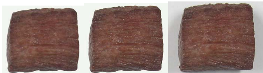
شکل ۱- پیش پردازش تصاویر مربوط به نمونه گوشتی که با پیش تیمار میکروویو W/g ۵/۲۳، در دمای ۱۶۰ درجه سانتی گراد و زمان ۴۵ ثانیه سرخ شده (از چپ به راست ابتدا حذف پس زمینه تصاویر با استفاده از نرم افزار فتوشاپ و سپس استفاده از فیلتر میانه با شعاع یک پیکسل)

شکل ۱ مراحل پیش پردازش تصویر را برای یک نمونه گوشت سرخ شده نشان می دهد. همان مقیاسی است که برای یک شیء استفاده می شود. در فرک لک این مقیاس برابر نسبت اندازه جعبه به اندازه تصویر می باشد؛ که منظور از اندازه تصویر، مرز شامل قسمت پیکسلی ۷ یک تصویر است. مقادیر خطای استاندارد در محاسبه بعد برخالی از رابطه (۳) محاسبه می شوند: